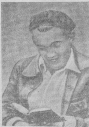
Азию — зимой 1934 года и осенью 1935 года.

О том, что увидел Фучик в нашей стране — об огромных масштабах строительства, великом труде советских людей, преобразующих страну, — коммунистический журналист с большой теплотой и радостью рассказывал в своей замечательной книге «В стране, где наше завтра уже стало вчерашним днем», в многочисленных очерках, репортажах, корреспонденциях. Они публиковались в газетах «Руде право» и «Руде вечерник», в журнале «Творба» и «Свет праде». Юлиус Фучик проявлял огромный интерес к советской Средней Азии. Он писал о том, что при помощи русского пролетариата среднеазиатские советские республики делают сказочные семимильные шаги, что здесь, в бывшей колонии царской России, быстро строится новая, социалистическая жизнь, неизмеримо быстро растут люди, что здесь все с большей конкретностью