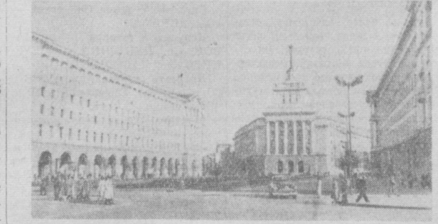
Народная Республика Болгария. София. Площадь имени Ленина.