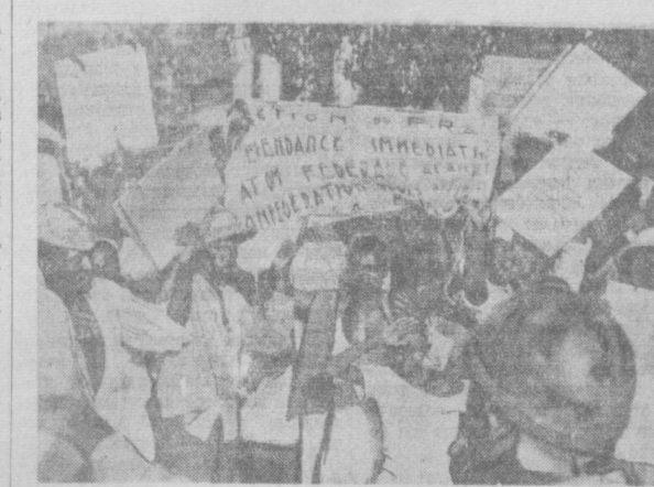
Западная Африка. По сообщению агентства Интерконтиненталь, в конце августа во время посещения генералом де Голлем Дакара «имели место инциденты». На площади Проте, где председатель Совета министров Франции выступал с речью, группы манифестантов несли лозунги с требованием независимости Сенегала. На снимке: группа участников манифестации.

КАИР, 15 сентября. (ТАСС). Представительство имамы Омана в Каире опубликовало заявление, в котором говорится, что английские оккупационные войска подвергли бомбардировке населенный пункт Курат, близ Низва, и подожгли расположенные вокруг него плантации. В ответ на это оманские патриоты, говорится в заявлении, совершили налет на один из английских укрепленных пунктов, расположенный недалеко от Низва. В заявлении сообщается, что в результате сражения были уничтожены две английские бронемашины и убито несколько английских солдат и офицеров. Визит города Навелии оманские патриоты сбили 4-моторный английский военный самолет.