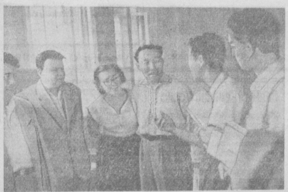
В Ташкенте регулярно проходят заседания азиатско-африканского подготовительного комитета по проведению Конференции писателей стран Азии и Африки. На снимке: в перерыве заседания.