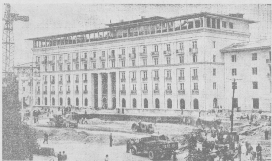
Новая гостиница «Ташкент»