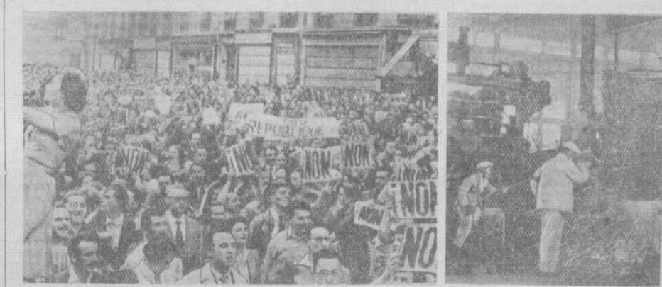
На снимках (слева направо): 1. В Париже, в районах, прилегающих к площади Республики, состоялась народная манифестация, проходившая под знаком защиты республиканского строя во Франции. Участники народной манифестации с планатами, на которых написано «Нет» 2. Кореянка Народно-Демократической Республики. Разлика металла на Сулчинском металлургическом заводе.

Профсоюз добивается заключения нового коллектинного договора с предпринимателями, который предусматривал бы более высокую заработную плату рабочих и улучшение условий труда.