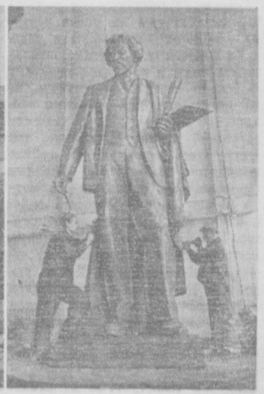
Ленинград. На заводе «Монумент-скульптура» отлит памятник Н. Е. Репину (автор — М. Манисер). На снимке: отделка скульптуры.