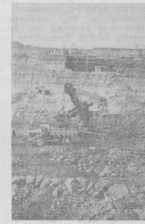
Кустанайская область. К 41-й годовщине Великого Октября — один миллион сто тысяч тонн руды даст Соколовско-Сарбайский горнообогатительный комбинат. На снимке: загрузка руды в самосвалы.