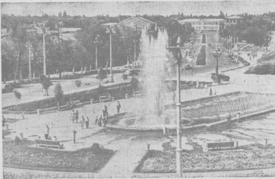
Ташкент. Комсомольская площадь.