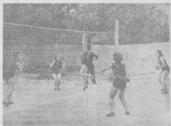
Одна из сильнейших волейбольных команд республики — команда Ферганской области на тренировке.