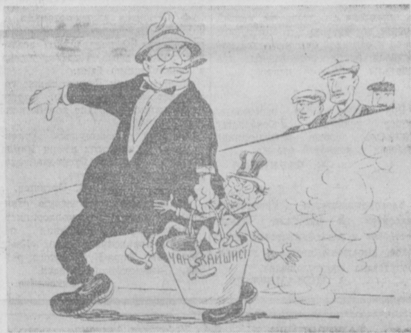
— Куда вы его, мистер, на свалку? — Нет — в ООН! Рис. И. Сычева. (Фотохроника ТАСС).

Представитель министерства иностранных дел КНР уполномочен заявить: В связи с этой серьезной военной провокацией Соединенных Штатов Америки правительство КНР делает тринадцатое серьезное предупреждение. ПЕКИН, 25 сентября. (ТАСС). Агентство Синхуа передает: 25 сентября восемь истребителей военно-воздушных сил США вторглись в воздушное пространство нашей страны в районе Сямьня. Представитель министерства иностранных дел КНР уполномочен заявить: В связи с этой серьезной военной провокацией Соединенных Штатов Америки правительство КНР делает тринадцатое серьезное предупреждение. МЕЖДУНАРОДНАЯ НАУЧНАЯ КОНФЕРЕНЦИЯ, ПОСВЯЩЕННАЯ 20-Й ГОДОВщИНЕ МЮНХЕНСКОГО СГОВОРА ПРАГА, 26 сентября. (ТАСС). Как сообщает Чехословацкое телеграфное агентство, здесь открылась Международная научная конференция, посвященная 20-й годовщине мюнхенского сговора. В конференции наряду с чехословацкими учеными участвуют 25 ученых из Болгарии, Франции, Голландии, Италии, Канады, Венгрии, Германской Демократической Республики, Польши, Румынии, Советского Союза и Великобритании.