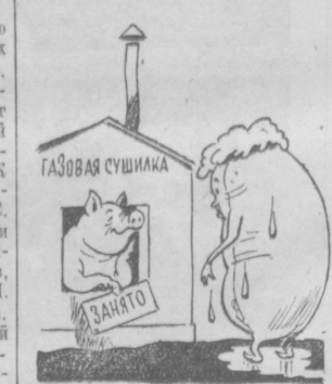
Рис. М. Воробейчикова.