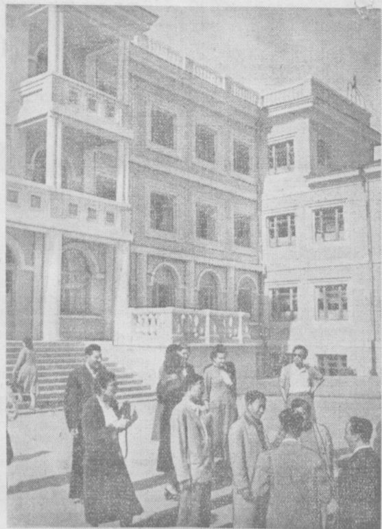
Члены Подготовительного комитета Конференции писателей стран Азии и Африки проявляют большой интерес к жизни Узбекской ССР. На снимке: члены Подготовительного комитета на территории медико-санитарной части Ташкентского текстильного комбината.