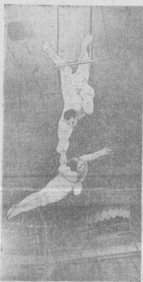
На снимке: под куполом цирка.

Программа первого вечера была посвящена предстоящей Конференции писателей стран Азии и Африки.