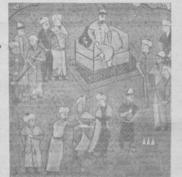
Миниатюра из рукописи XVI века «История Абулхайр-хана». Работа неизвестного художника.