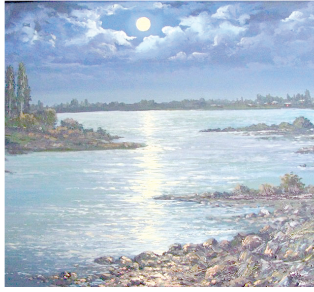
Сирдарё. Шафақ (2010).