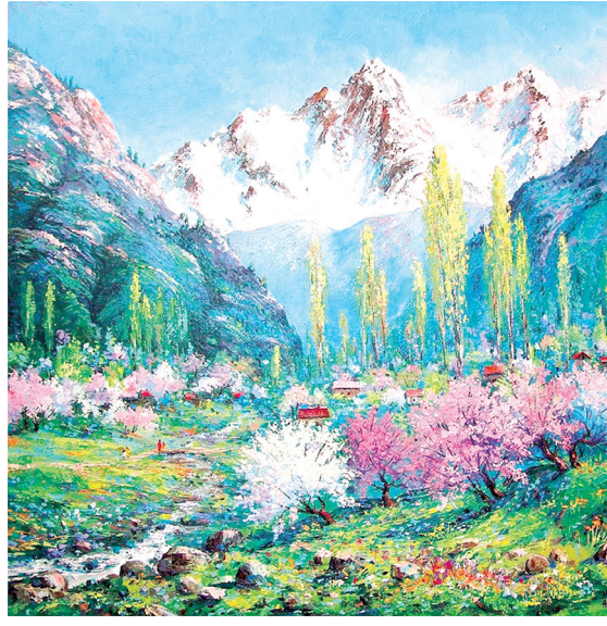
Зоминда баҳор (2008).