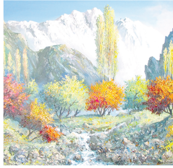
To'gda kuz (2019).