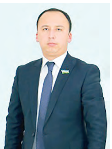
Нодиржон АБДУСАЛИЕВ, Олий Мажлис Қонунчилик палатаси депутати, O'zLiDeP фракцияси аъзоси:

Йиғилишда депутатлар кун тартибига киритилган навбатдаги ҳужжат – "Ер ости бойликлари тўғрисида"ги қонун лойиҳасини ҳам иккинчи ўқишда атрофлича муҳокама қилишди.