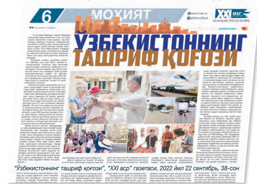
“Ўзбекистоннинг ташриф қоғози”, “XXI asr” газетаси, 2022 йил 22 сентябрь, 38-сон

Кўпчилик дўстларим билишади, яқинда бир ҳафтага она юртимга бориб келдим. Халқимизнинг “Ўзингга эҳтиёт бўл, кўшинингни ўғри тутма” деган доно нақлига амал қилиб, ИИБга бордим. 50 минг сўмча тўлаб, ўзимни вақтинчалик қайд қилдириб қўйдим. Шу билан иш битди, деб адашган эканман.