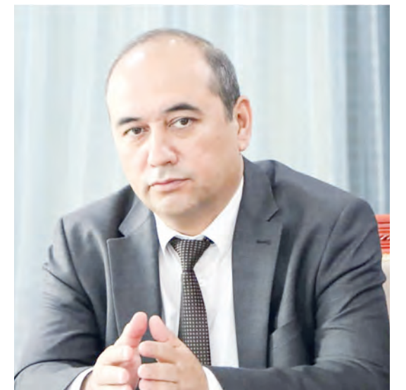
Баҳодиржон ШЕРМУҲАММАДОВ, Фарғона давлат университети ректори

Ишонимизки, гўзал заминимизда "Олтин водий сайёҳлик ҳалқаси" албатта қад ростилади ва жозибадор масканга айланади. Зотан, давлатимиз раҳбари таъкидлаганларидек, "...Туризм – бу ҳам инвестиция, ҳам экспорт, ҳам янги иш ўринлари ва камбағалликни қисқартириш дегани" дир.