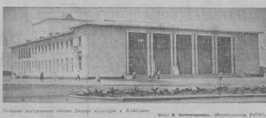
Недавно построенное здание Дворца культуры в Алмаляке.