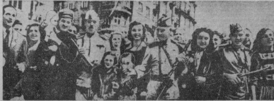
9 сентября 1944 года. Лихующая София встречает советских солдат.

Исторический опыт учит, что для социалистических стран нет и не может быть другого пути развития, кроме пути дальнейшего всестороннего укрепления сотрудничества с Советским Союзом. Болгарские коммунисты и весь болгарский народ решительно осуждают раскольничью деятельность руководителей китайской Коммунистической партии, отступивших от марксизма-ленинизма и пролетарского интернационализма.