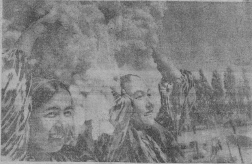
Первый хлопок Каракалпакии.