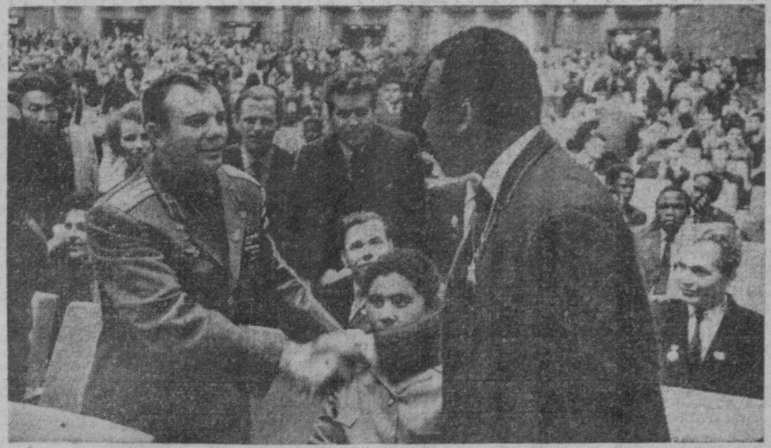
16 сентября в Кремлевском Дворце съездов состоялось торжественное открытие Всемирного форума солидарности молодежи и студентов в борьбе за национальную независимость и освобождение, за мир. На снимке: в зале заседаний Советский комсомолец Юрий Гагарин общается с участниками с одним из участников форума.