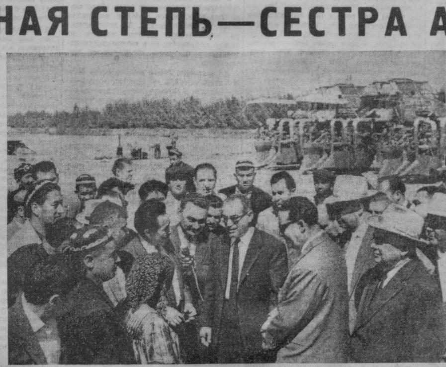
Премьер-Министр ОАР Али Сабри в голоднестепском совхозе № 6.