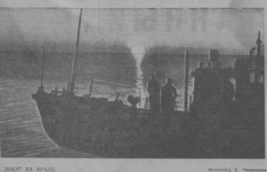
ЗАКАТ НА АРАЛЕ.