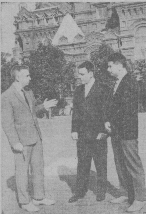
Советские космонавты на Красной площади в Москве. Слева направо — К. П. ФЕОКТИСТОВ, В. М. КОМАРОВ и Б. Б. ЕГОРОВ

ПРОГРАММА НАУЧНЫХ ИССЛЕДОВАНИЙ ВЫПОЛНЕНА ПОЛНОСТЬЮ ЭКИПАЖ ЗВЕЗДОЛЕТА ВЛАДИМИР КОМАРОВ, КОНСТАНТИН ФЕОКТИСТОВ И БОРИС ЕГОРОВ ЧУВСТВУЮТ СЕБЯ ХОРОШО