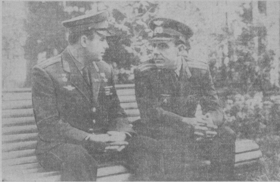
Космонавты Ю. Гагарин и В. Комаров в «Звездном городке».