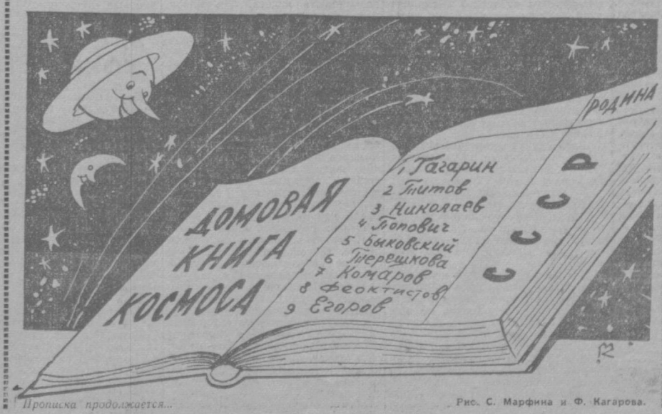
Прориска продолжается...

За последнее время в Книге Почета ЦК ВЛКСМ ежегодно пополняется именами героев космоса. В год — два имени. Теперь традицию эту пришлось нарушить. В летопись комсомольской славы внесены фамилии сразу трех советских космонавтов. Такое решение принято 13 октября ВЛКСМ Владимира Михайловича Комарова, Константина Петровича Феоктистова и Бориса Борисовича Егорова. Герои космоса награждены также значками «За активную работу в комсомоле». (ТАСС). ПРИЕМ Н. С. ХРУЩЕВЫМ Г. ПАЛЕВСКОГО СОЧИ, 13 октября, (ТАСС). Сегодня Председатель Совета Министров СССР Н. С. Хрущев принял находившегося с визитом в Советском Союзе государственного министра Франции по делам научных исследований, по атомным и космическим вопросам Гастона Палевого и имел с ним дружественную беседу.