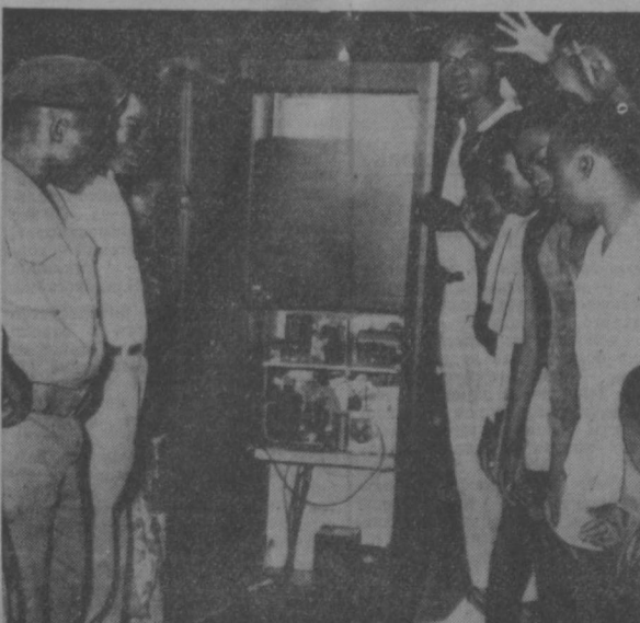
Прески колонналистских кругов, направленные службой жандармской Полиции Кюмо, не прекращаются. Недавно служба безопасности законного правительства захватила радиопередатчик и группы бельгийских колонизаторов в одном из районов Восточной провинции. Передатчик тайно использовался для пропаганды против законного правительства Антуана Гизенки.

КАК ПЕРЕДАЕТ ИЗ ЛИМЫ АГЕНСТВО ПРЕССА ЛАТИНА, СЕНАТОР АСТЕ АБРАЛЬ ЗАЯВИЛ В ПЕРУАНСКОМ ПАРЛАМЕНТЕ, ЧТО ПРАВИТЕЛЬСТВО МАНУЭЛЯ ПРАДО ОТВЕЧАЕТ НА ТРЕБОВАНИЯ НАРОДА СЛЕЗОТОЧИВЫМ ГАЗОМ.