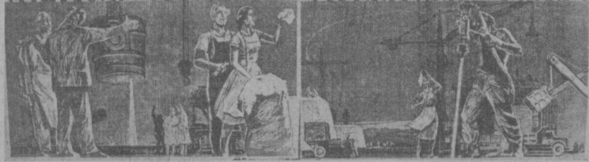
Плакат художника А. Королева, выпущенный издательством «Узбекистан» к юбилею республики и Компартии Узбекистана.