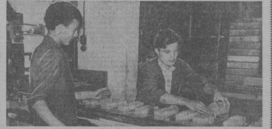
Рабочие Алжира, Орана, Константина и других городов Народной Демократической Алжирской Республики взяли в свои руки управление заводами и фабриками. На них созданы комитеты самоуправления. Сейчас в стране около 500 таких предприятий. Благодаря народной инициативе в стране закладываются основы будущего социалистического сектора национальной экономики. На снимке: на одном из национализированных предприятий пищевой промышленности.

Врач, секретарь комсомольской организации Ташкентского медицинского института.