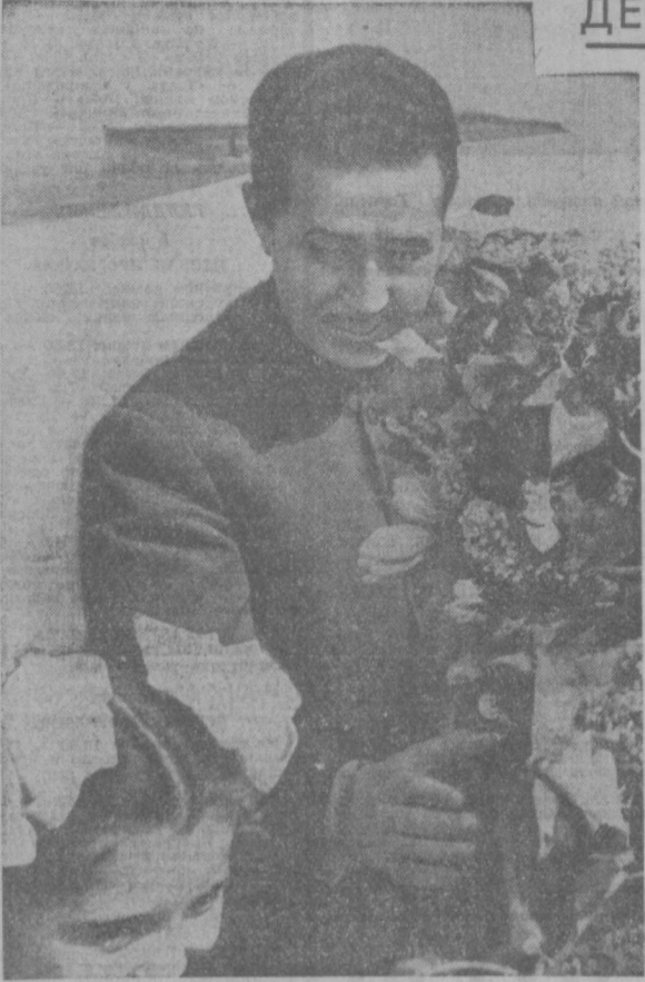
Апрель 1964 года. Ташкентский аэропорт в праздничном убранстве. Трудящиеся Советского Узбекистана сердечно приветствуют дорогих посланцев братского Алжира — генерального секретаря партии Фронт национального освобождения, президента Алжирской Народной Демократической Республики Ахмеда Бен Беллу, его друзей и соратников. В их лице они приветствуют героический народ Алжира, который ценою огромных жертв вырвал у колонизаторов право быть хозяином своей судьбы и своей родины, право строить у себя в стране новую, светлую жизнь.