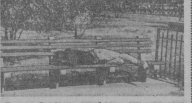
На статуе «Свободы» написано: «Дайте мне вечных уставших, нищих, жаждущих дышать свободой, несчастных, отвергнутых вашими неприветливыми берегами». А в это же время в самом Нью-Йорке...

утро, а в Ташкенте полдень. Мы летели домой, навстречу солнцу. Уже на двадцать минут полета стюардесса, мило улыбаясь, начинает знакомить нас с правилами поведения пассажиров на случай аварии на высокогорном самолете «Боинг». Если самолет вздумает развалиться в воздухе, каждый обязан надеть на себя оранжевый надувной жилет. Лишь в таком виде