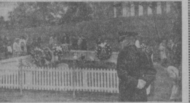
Каждые двадцать минут в часовне Джона Кеннеди поменяются новые цветы.