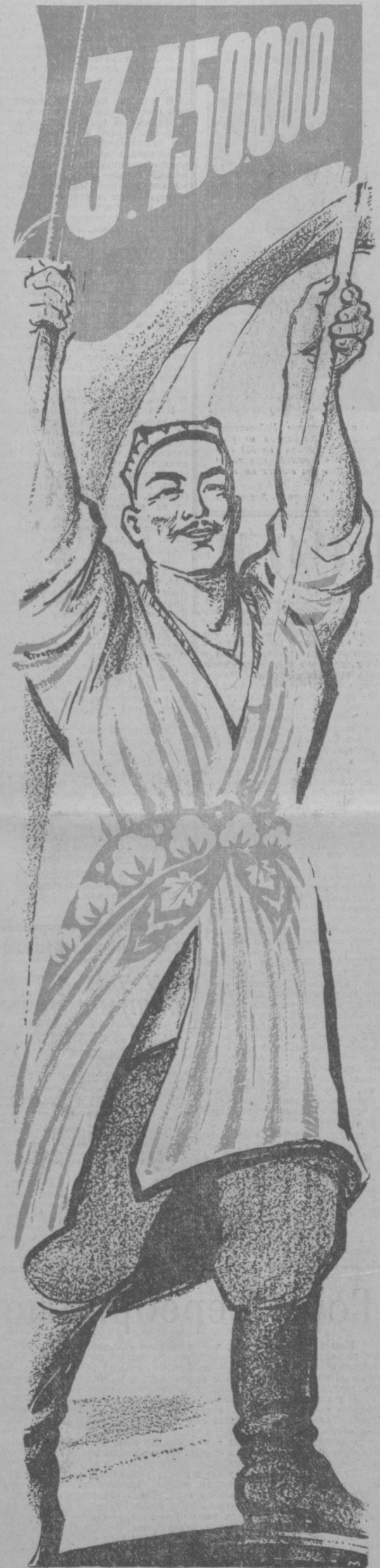
Рисунок С. Марфина и Ф. Нагарова.