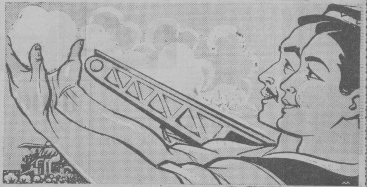
Рисунок С. Марфина.

НА ГОСУДАРСТВЕННЫЙ ХИРМАН СДАНО 3.600.000 ТОНН ХЛОПКА