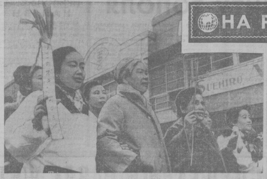
Недавно в столице Японии Токио состоялась демонстрация женщин против роста дороговизны в стране. Они передали в парламент петицию, в которой осуждают повышение цен на потребительские товары, пищевые продукты и на увеличение платы за проезд на городском транспорте.