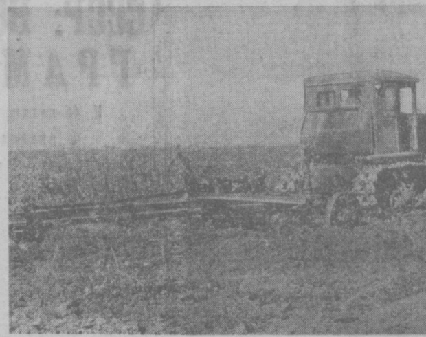
Хлопкоробы республики закладывают прочную основу будущего урожая. На плантациях совхозов и колхозов не умолкает гул тракторов. Идет взмет зби. На снимке: закладываются последние гектары в совхозе «Пактакор» Сырдарьинской области.