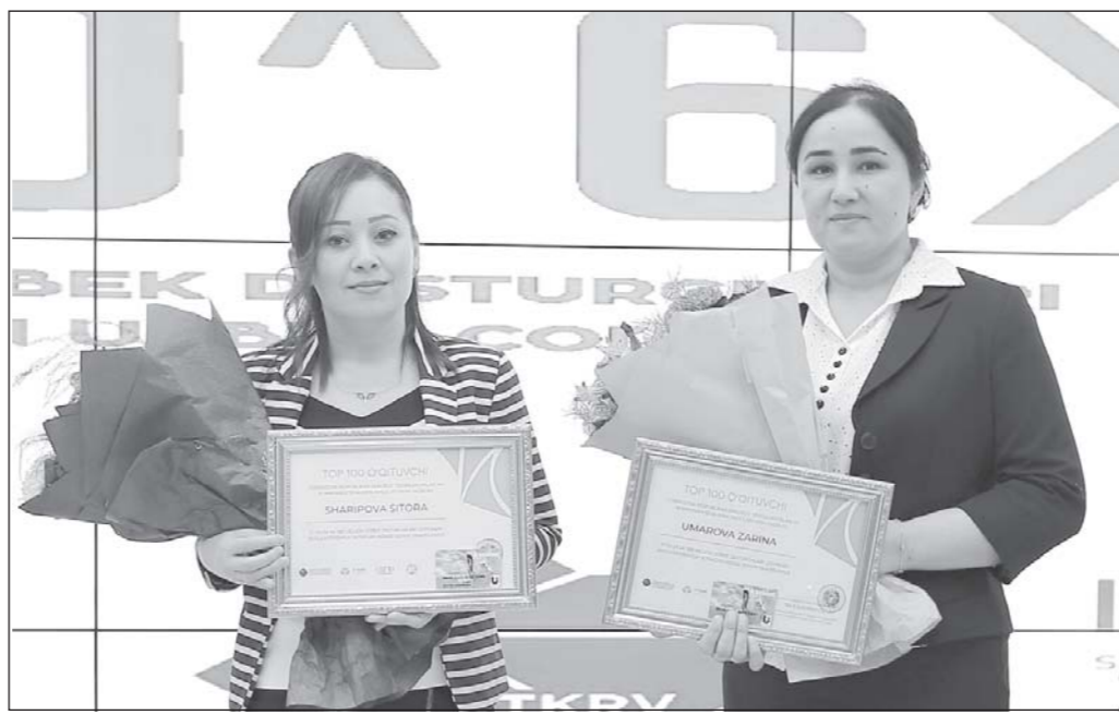
Мувофиқи қарори муштарак Вазорати таълими халқ ва Вазорати технологияҳои иттилоотиву рушди коммуникацияҳо...

Шавкат МИРЗИЁЕВ, Президенти Ҷумҳурии Ўзбекистон.