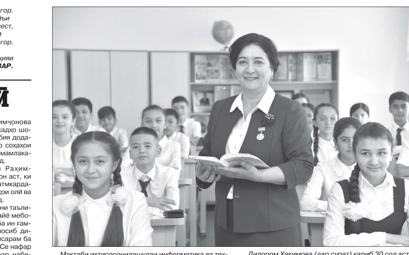
Мактаби ихтисосонидашудаи информатика ва технологияи ахбори рақами 8-уми шаҳри Навоӣ на фақат дар шаҳр, балки дар вилоят низ яке аз масканҳои таълими намунавист.

Пардабӯи ЭРҒАШЕВ, шаҳри Ғазалкенти вилояти ТОШКАНД.