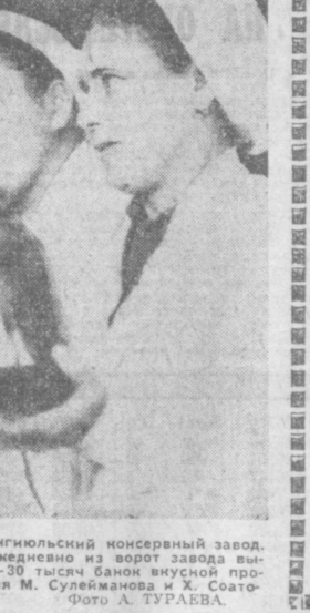
Более 40 видов овоще-фруктовых консервов производит Янгйульский консервный завод.