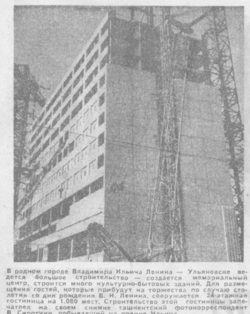
В родном городе Владимира Ильича Ленина — Ульяновске ведется большое строительство...