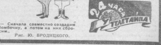
— Сначала совместно создадим бомбочку, а потом на них сбросим... Рис. Ю. БРОДИЦКОГО.

Стоимость жизни в Канаде продолжает неуклонно расти. По данным канадского статистического бюро, розничные цены повысились в 1968 году на 4,2 процента. Это самый большой рост за последние 18 лет.