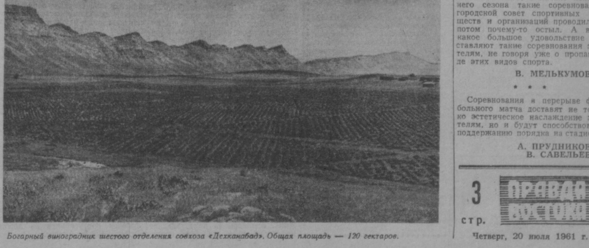
Богарный виноградник шестого отделения совхоза «Декханабд». Общая площадь — 120 гектаров.

Работники книжного магазина в Нукусе умело ведут пропаганду книг. По одной в местной печати сообщается о полученных новинках. Принимаются заявки на пересылку книг по почте. Много заявок поступает от читателей из Каракалпакки, провинция в других городах страны — Москве, Киеве, Ленинграде. Маганы значительно перевыполнили полугодовой план товарооборота. О. ЛАРИН, г. Нукус.