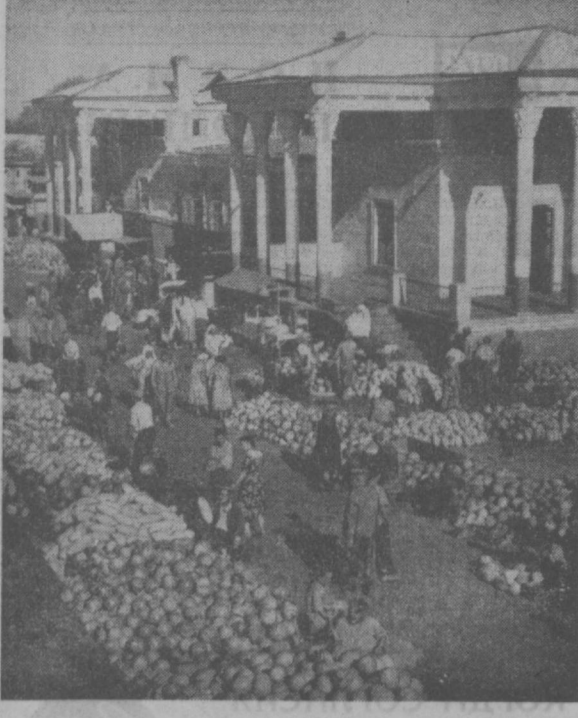
На самаркандском рынке — горы овощей.

Кому не хочется в знойный день окунуться в прохладную воду бассейна? Для детей нет большего удовольствия. И поэтому маленькие самаркандцы спешат к парку-озеру. Казалось бы, как не позаботиться о внешнем виде, о красоте оформления этого места отдыха. А на самом деле... С весны оформители парка установили у его входа скульптуры. Но у них вид опавших в катастрофу. Отбитые руки, вы-