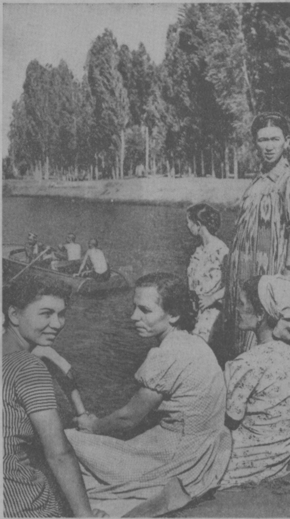
Выполнять семичасовое задание за шесть часов, постоянно учиться, повышать свой культурный уровень, быть примером в быту, интересно, содержательно организовывать свой досуг — таково обязательство девушек из бригады коммунистического труда Гатялы Кардам с Кокандской швейной фабрики имени Ахунбабаева. Бригада отлично трудится и учится, умеет хорошо отдыхать. Каждый выходной день большая часть членов бригады вместе с другими рабочими фабрики выезжает в живописные окрестности города, на Сыр Дарью или на Комсомольское озеро.