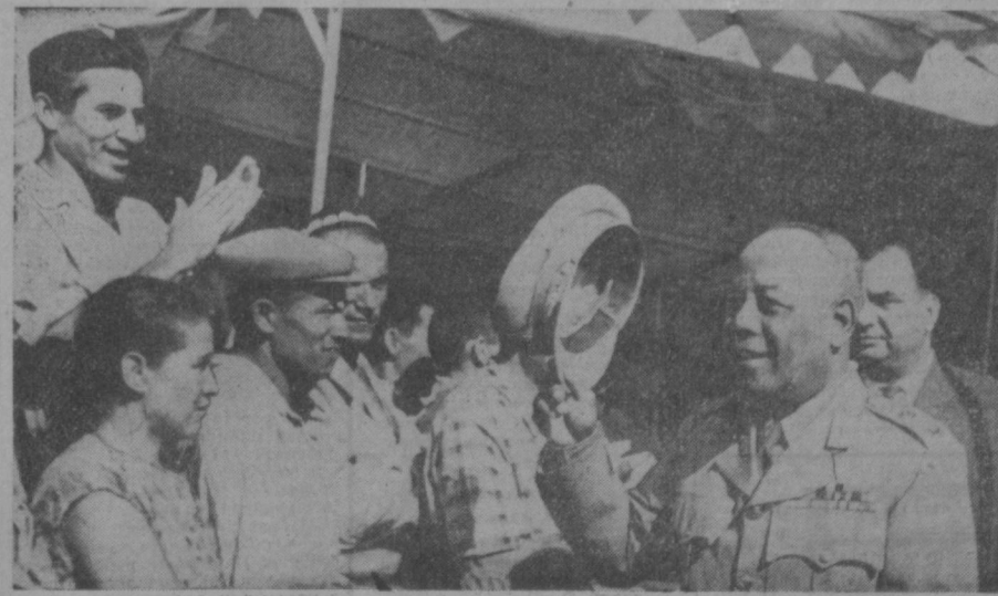
Встреча Председателя Верховного совета вооруженных сил и премьер-министра Судана генерал-лейтенанта Ибрагима Аббуды в Ташкентском аэропорту.

Хлопкоробы района обратились с призывом поддержать их начинание ко всем сельским труженикам Ферганской области.