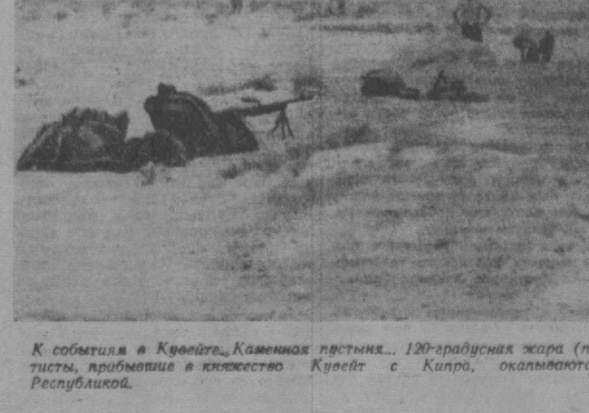
К событиям в Кувейте. Каменистые пустыни... 120-градусная жара (по Фаренгейту). Английские парашютисты, прибывшие в Кувейт с Кипра, окаймляются недалеко от границы с Иракской Республикой.