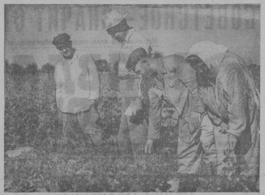
Члены эскадронной бригады хлопководов Туркмени осматривают хлопчатник на полях колхоза имени Сталина Бухарского района.

По темпам вегетационных поливов первенство держат Ферганская и Андижанская области, где хлопчатник полив 2,1 раза. Хуже всего обстоит дело с поливами в Бухарской области (1,3 раза) и в Каракалпакской АССР (1,2 раза). Особенно плохо организованы поливы в совхозах Каракалпакии, которые на значительной площади до сих пор не провели ни одного полива. Несмотря на острое маловодье, кратность поливов в этом году держится по республике на уровне прошлого года. Подборка проведена 2,4 раза. В Андижанской, Самаркандской и Бухарской областях кратность подбора составляет 2,7 раза, а в Каракалпакской АССР — лишь 1,7 раза. Ворьба за 3 миллиона 200 тысяч гонн хлопка в самом разгаре. Задача состоит в том, чтобы ни на один день не ослабить темпов ухода за посевами, создать хлопчатнику самые благоприятные условия для нормального развития и обильного плодоношения.