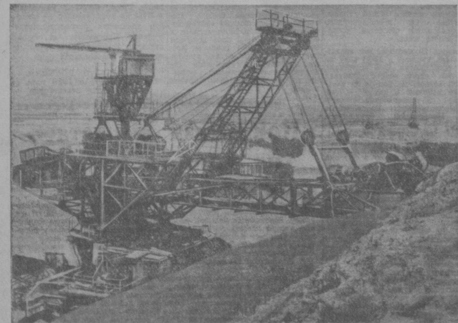
Здесь будет новое водохранилище! Оно сооружается на территории Шурчинского района и называется Южношурчинским. Коллектив ирригаторов охвачен единым порывом — поставить на службу великому делу коммунизма еще десятки тысяч гектаров пустынных земель. В орошенной степи зазеленеют плантации тонковолокнистого хлопка. А сейчас гудят моторы, вертятся в землю ковши, все выше поднимаются яхоты. Строители коммунизма несут трудовую вахту в честь партийного съезда.

Новая Программа нашей партии — вдохновенно сказал он, — призывает нас к созданию изобилия продуктов во имя счастья трудового человека. Как же нам не откликнуться на этот пламенный призыв. Мы примуем на себя усилие, чтобы еще раньше, чем мы намечали, выполнить наши обязательства по производству хлопка, кукурузы и других продуктов сельскохозяйственного производства.