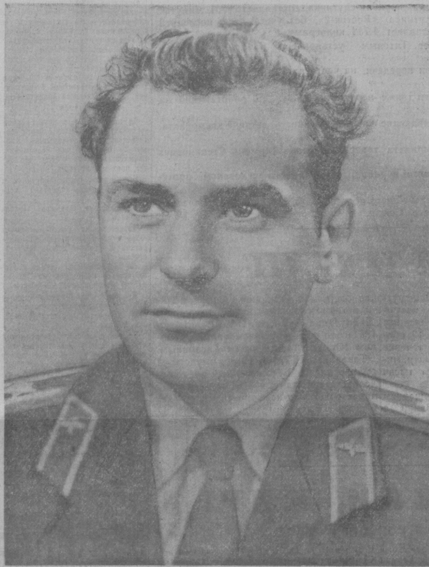
Герман Степанович ТИТОВ

ЦЕНТРАЛЬНЫЙ КОМИТЕТ КОММУНИСТИЧЕСКОЙ ПАРТИИ СОВЕТСКОГО СОЮЗА ПРЕЗИДИУМ ВЕРХОВНОГО СОВЕТА СССР СОВЕТ МИНИСТРОВ СССР