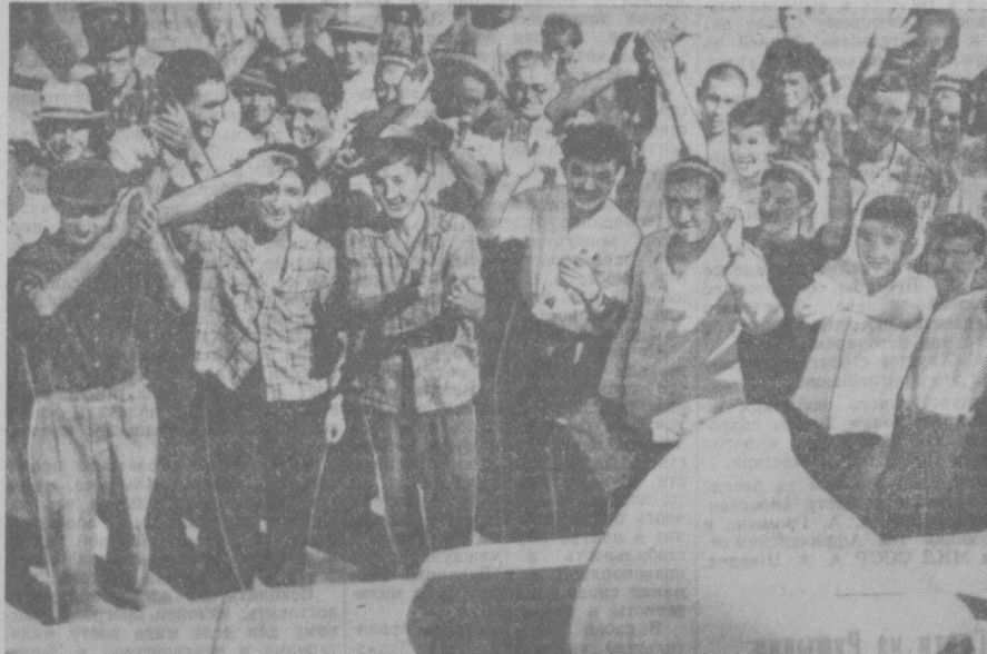
Трудящиеся столицы Узбекистана салютуют на Театральной площади сообщению ТАСС о полете второго космического корабля-спутника «Восток-2» с человеком на борту.

ПАРИЖ, 6 августа. (ТАСС). Буквально через несколько минут