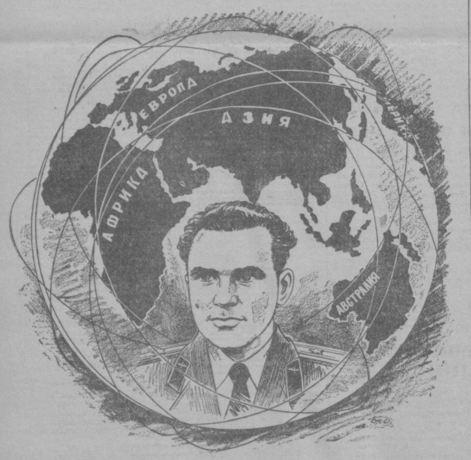
Всю-то я вселенную проехал!

ство, в честь летчика-космонавта Германа Степановича Титова. На приеме присутствовали руководители Коммунистической партии и Советского правительства, государственные и общественные деятели, представители общественности Москвы, а также замечательные советские патриоты, работающие в области освоения космоса.