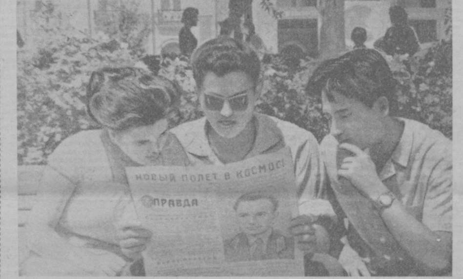
В эти дни на улицах Ташкента.

Типография Объединенного издательства газет «Кизил Узбекистон», «Правда Востока» и «Узбекистон сури», г. Ташкент. Р.07350. Изд. № Б-494.