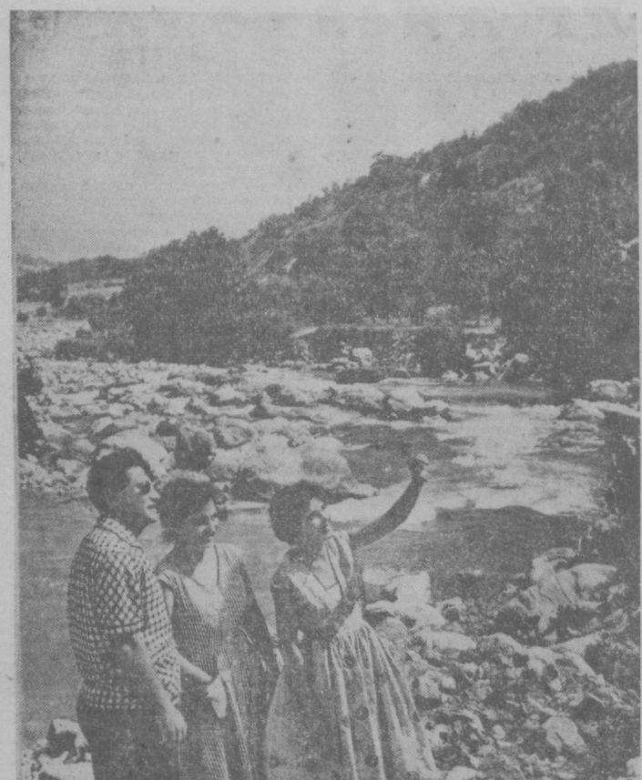
Вот она, долина реки Угам, один из живописных уголков в Бостандыкском районе. Склоны, покрытые садами, прозрачная ледяная вода стремительного потока, щедрое солнце и удивительно чистый свежий утренний воздух!