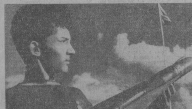
Недавно в Риге состоялся финал Всесоюзных соревнований по техническому виду спорта. Большим успехом добилась портсмента-авиамоделист Узбекистана.