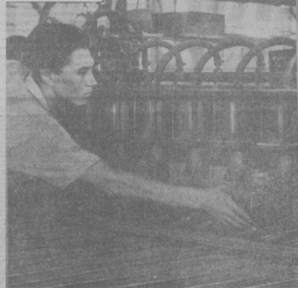
В период развернутого строительства коммунизма еще более повышается роль и ответственность члена партии. Коммунист обязан всем своим поведением на производстве, в общественной и личной жизни показывать высокие образцы борьбы за развитие и улучшение коммунистических отношений, соблюдать принципы и нормы коммунистической морали. КПСС будет поощрять свои ряды за счет наиболее сознательных и активных тружеников, сохраняющих в чистоте и высоко держать звание коммуниста.

Советский народ встретил проекты новой Программы и Устава Коммунистической партии с огромным воодушевлением. Неизданный политический и трудовой подъем охватил всю нашу страну, всех трудящихся городов и сел. Исторические документы, как сарды ярий мала, осветили нам путь вперед, и коммунизму. Особой радостью и гордостью за родную партию приспешены мы, старые коммунисты, участники превращения в жизнь первой и второй Программы Коммунистической партии Советского Союза. На наших глазах росла и крепла партия, организованная и выстоявшая в великие Ленинские дни. Руководствуясь марксистско-ленинской наукой и сформулированными на ее основе программами, наша партия смогла добиться победы. Под руководством партии советский народ построил социализм, разгромил гитлеровские полчища, занял свои, завоеванные войной, и вступил в эпоху строительства коммунизма. Теперь Коммунистическая партия Советского Союза принимает свою третью Программу — программу построения коммунистического общества. Новая Программа творчески обобщает практику строительства социализма, учитывает опыт рабочего и крестьянского движения во всем мире и выражает коллективную мысль партии, определяет главные задачи и основные этапы коммунистического строительства.