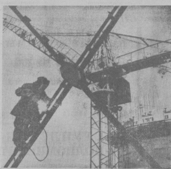
Огни сварки... Своими короткими, яркими вспышками они освещают строительную площадку, где сооружается Ферранский аэрокосмический завод. Воздушные военные великими задачами построения коммунизма, изложенными в проекте Программы КПСС, строители решили ко дню открытия съезда партии завершить сооружение объектов первой очереди, а к концу года довершить сдать ее в эксплуатацию.