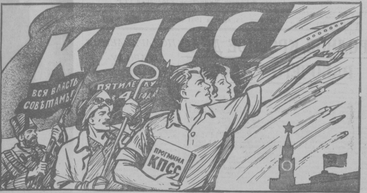
Рисунок В. Жарникова.