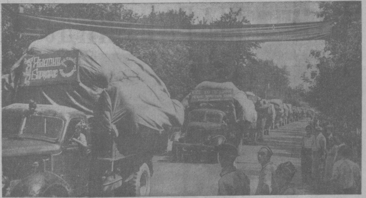
Вчера в Коканде. Двигается красный обоз с первыми тоннами «белого золота», выращенного и собранного хлопкоробами Пала.