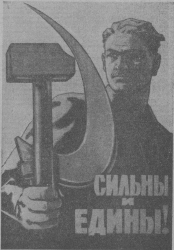
Плакат К. ИВАНОВА, (Изюга).

БЕРЛИН, 25 августа. (ТАСС). Как сообщает агентство АН, в ночь на 24 августа западноберлинские провокаторы попытались разрушить в двух местах пограничные сооружения на границе между столицей ГДР и Западным Берлином. 24 августа министерство внутренних дел ГДР еще раз обратилось ко всем гражданам Западного Берлина с призывом в интересах их собственной безопасности воздерживаться от каких бы то ни было сборов провокационного характера на границе. Еще раньше министерство рекомендовало держаться на западноберлинской стороне на расстоянии не менее 100 метров от войск обеспечения безопасности ГДР.