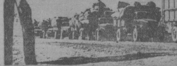
Став на трудовую ваху в честь XXII съезда КПСС, труженики полей Узбекистана с каждым днем наращивают темпы уборки хлопка. В предыдущем номере «Правды Востока» сообщалось, что в числе других районов республики начал сбор сырья нового урожая в Кассанский. На снимке фотокорреспондента Узбекского телеграфного агентства А. Кима показан красный обоз совхоза имени Хрущева.

Для первых года семилетия ознаменованы в республике серьезными сдвигами в механизации уборочного урожая. В 1959 году машинами было собрано 330 тысяч тонн хлопка, а в прошлом сезоне — 500 тысяч тонн.