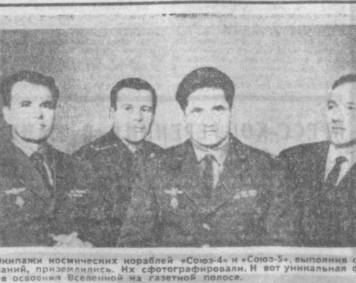
Эпизоды космических работ «Союз-4» и «Союз-5», выполнив сложную программу исследования, приземлился. Их сфотографировали. И вот уникальная фотография с надписью героев освоения Вселенной на газетной полосе.