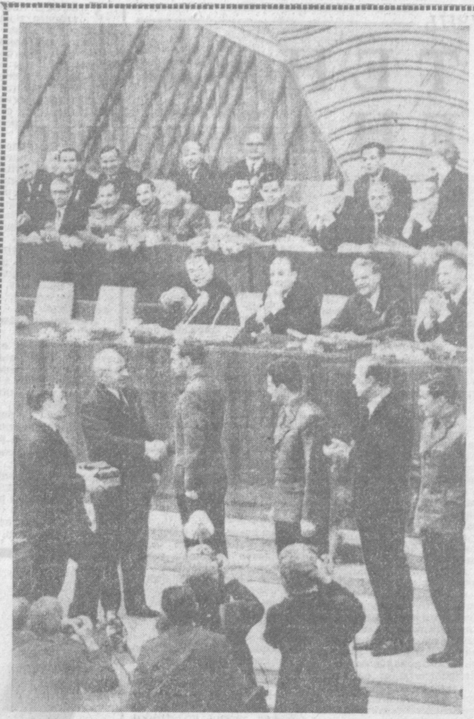
Москва, Кремлевский Дворец съездов. Н. В. Подгорный вручает награды летчикам-космонавтам В. А. Шаталову, Б. В. Волынову, А. С. Елисееву и Е. В. Хрунову.

Председатель Президиума Верховного Совета ССР И. ПОДГОРНЫЙ, Секретарь Президиума Верховного Совета ССР М. ГЕОРГАДЗЕ. Москва, Кремль, 22 января 1969 г.