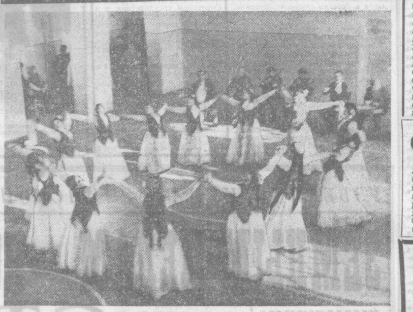
Приближаются дни встречи зрителей Ташкента и других городов и поселков Узбекистана с самобытным и жизнеутрачивающим искусством и литературой Каракалпакской АССР. Девственно готовится поэты, писатели, работники искусства и миниматриоды автономной республики к смотрю своих достижений. Артисты Государственной филармонии Каракалпакской АССР имени Бердах готовят и на неделю ряд оригинальных номеров. На снимке: танец «Белое золото» в исполнении танцевального ансамбля филармонии.