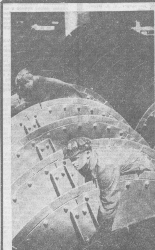
Золото Мурунтау... Все ближе время, когда оно пойдет на нужды экономики и культуры нашей страны. В комплексе будущего промышленного комбината готовится золотодобывающая фабрика. На этом снимке запечатлен момент монтажа ее мельничной установки.

Нет никакого сомнения, что ученые-экономисты обеспечат дальнейшее теоретическое развитие экономической науки, внесут новый вклад в строительство коммунизма.