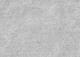
Смертоносное дыхание Невады. Рис. Ю. БРОДИЦКОГО.

В результате прорыва в атмосферу продуктов распада ядерного топлива США в Неваде яд в американском городе выпали радиоактивные осадки. (Из газет).