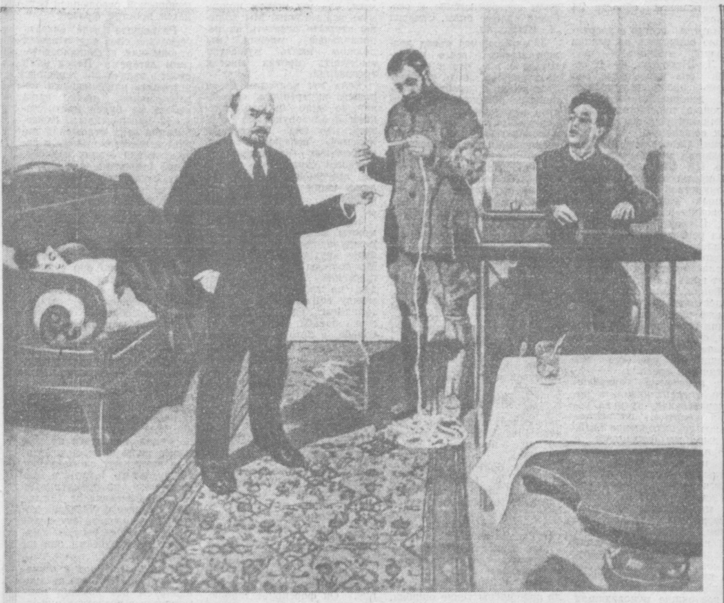
В. И. ЛЕНИН У ПРЯМОГО ПОВОДА.

отставших стран, В. И. Ленин определил основные формы и методы строительства социализма в этих странах. Особое внимание уделял он укреплению партийных организаций, их связям с трудящимися коренных национальностей, упрочению союза рабочего класса с крестьянством, усилению помощи русского пролетариата трудящимся национальностям окраин во всех сферах экономики и культуры.