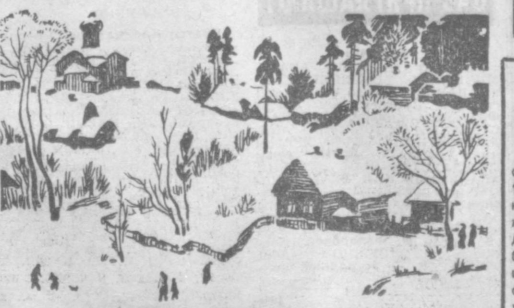
Художник Р. ЛЕВАНЦКИЙ.

ПСКОВЩИНА издавна известна как боевой рубеж нашей Родины. Ее крепости-монастыри столетиями надежно охраняли границы Руси от иноземных завоевателей. Памятник зодчества здесь носит особый, свободолобный характер и отличается удивительной скульптурностью своих форм. Сложенные из бережно и скупко отесанного белого камня, стены их неровны и кажутся — как бы спеленутыми вручную. От этого все постройки на Псковщине удивительно органично входят в окружающий пейзаж.