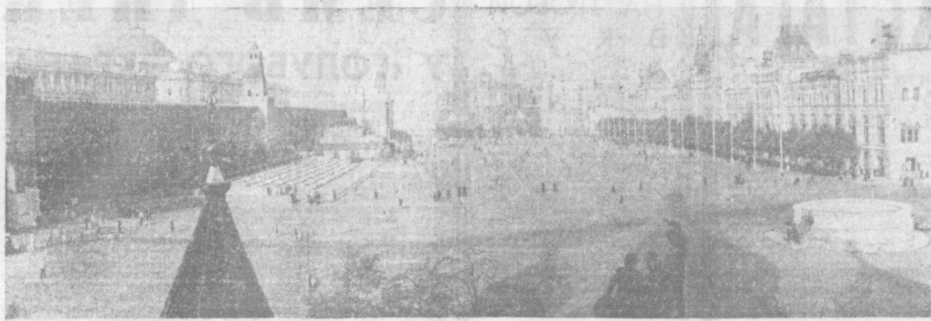
МОСКВА. Красная площадь.