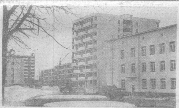
В тащившемся жилком квартале Ц-4 воронежские строители возводят несколько четырех- и девятиэтажных домов. Эти дома, которые вы видите на снимке, уже готовы и заселены.

А. МАЛЮТИН, Редактор газеты «Огни Чарвака».