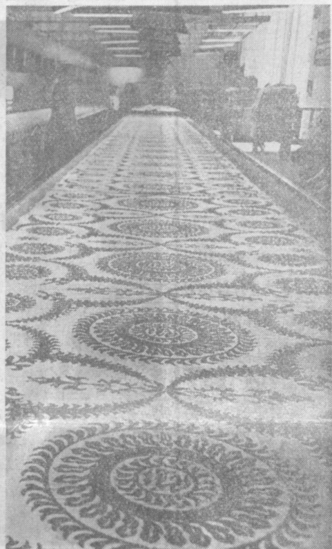
Ташкентской шелководческой фабрике имени 26 банинских комсомолов исполнилось 35 лет. Сейчас она — одно из крупнейших промышленных предприятий столицы республики. Ее продукция — почти десять миллионов метров тканей 14 наименований в год. Коллектив фабрики влился во всенародное соревнование за достояние вступил 100-летию со дня рождения В. И. Ленина. На снимке: набойщица фабрики.

Завершено составление проектно-сметной документации на строительство молокоприемного пункта в Ромитане. Предусмотрена автоматизация наиболее трудоемких процессов по первичной обработке молока.