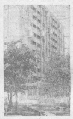
Одни из домов для рабочих в восточной части Гаваны.

Что за химера — человек! Что за чудовище! Любитель хаоса, противоречие существа... Что за выдумка! Сладоблиный червь земли... Слад и позор вселенной... Блез Паскаль (1623—1662).