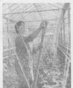
Вблизи города Стара-Загора (Болгария) завершается строительство теплиц. Здесь уже зреет зинная укропная капуста.