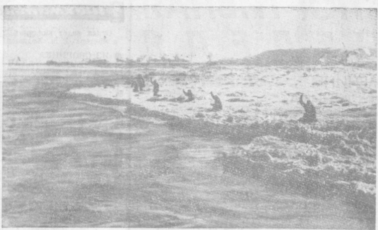
На реке Сыр-Дарье развернулась противолодочная борьба. Круглогодичную вахту несут взрывники республиканского специализированного управления «Союзвзрывпром». У автомобильного моста река особенно опасна — кругом мели, песчаные полосы, на которых образовались торосы. Опытные взрывники смело устраняют заторы. Только за минувшую неделю они использовали здесь более шести тонн взрывчаток. На снимках: сверху — подготовка взрыва льда на реке Сыр-Дарье; внизу — массивированный взрыв.