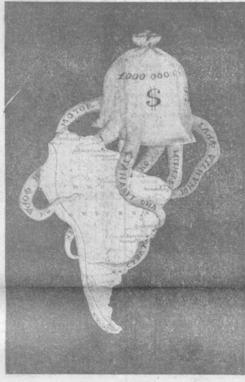
Монополии США проводят планомерное ограбление природных богатств стран Южной Америки. (Из газет).