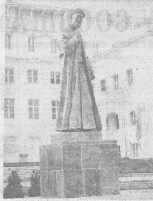
Памятник Алишеру Навою перед литературным музеем его имени в Ташкенте.