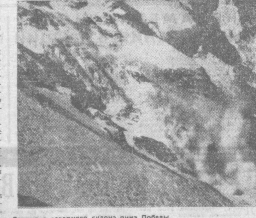
Лавина с северного склона пина Победы.

ДЕТИ от души радовались белому пушистому снегу. В наших краях он редкий гость. Родовые и любители лыжи, предвкушая головокружительные спуски. Но чем толще снежный пласт, тем тревожнее всматриваются люди в серое небо: когда же он перестанет сыпаться? Ведь вместе со снежным пластом растет и опасность, которая таится в его рыхлой ослепительной пелене.