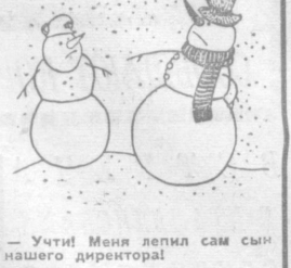
Учти! Меня лепил сам сын нашего директора!