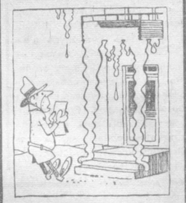
Странно! Ухорил на работу, колонн вроде бы не было.

ВОЛЕЙБОЛИСТЫ тагантинского «Автомобилиста» продолжают спор за право быть в группе лучших команд страны. Проведя несколько тренировок дома, наша команда выехала в Вильнюс, где состоятся четыре матча — с динамовцами Ленинграда, тагантиским «Калевом», рижской «Даугава» и вильнюсским «Электроном».