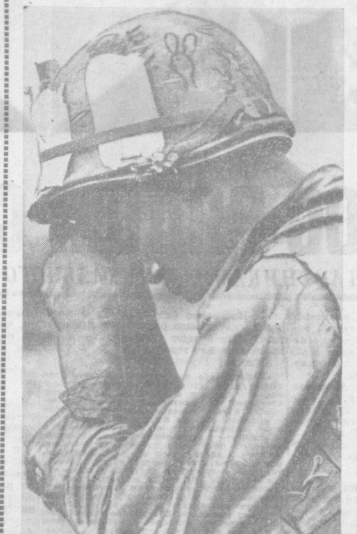
Этому уставшему от войны американскому солдату есть о чем подумать. Боицы Народных вооруженных сил освободили Южного Вьетнама...