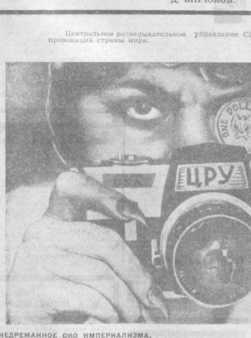
Недреманное око империализма. Фотоколлаж Ю. Бродницкого.