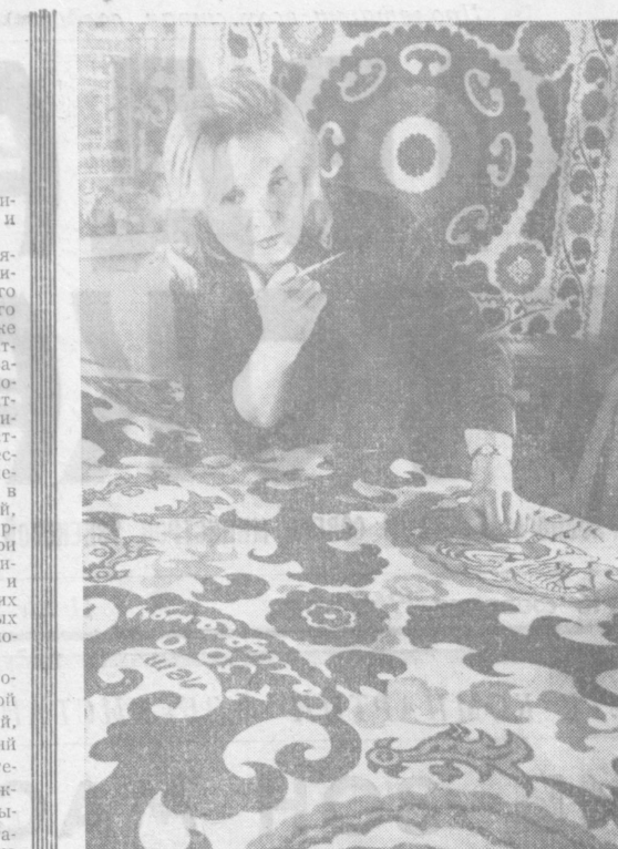
Большую партию декоративных тканей с изобразением архитектурных памятников старинной Самарканды выпустит и юбилейного шёлкоткацкая фабрика имени 26 банных комиссаров...