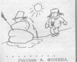
Рисунки А. Фоминна.

РЕШЕНИЕМ Комитета по физической культуре и спорту при Совете Министров СССР команды гандболистов тагантинского «Буревестника» и ЦСКА вошли в первую лигу класса «А». Это вызвано тем, что сборной команде СССР предстоят ответственные турниры — чемпионат мира 1970 года и Олимпиада. Увеличение числа сильнейших команд обещает сделать чемпионат страны этого года весьма интересным. Дебют тагантинского «Буревестника» уже не за горами. С 27 февраля по 8 марта в Свердловске состоится первый тур. У наших земляков будут очень сильные соперники — спортклуб Кунцево, «Буревестник» (Краснодар), «Жальгирис» (Каунас), «Буревестник» (Запорожье) и две армейские команды из Киева и Львова.