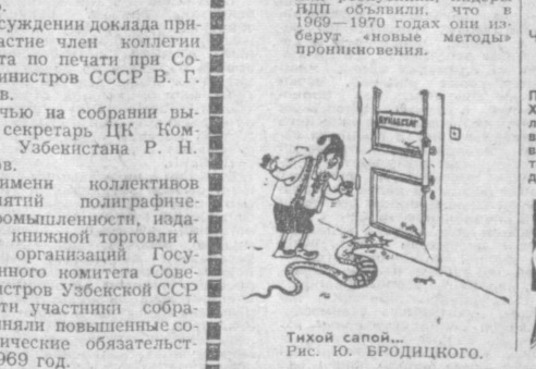
Тихий сапог...