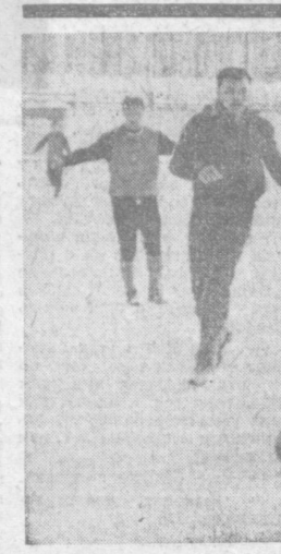
В любую погоду ведут тренировочную работу футболисты ташкентского «Пахтакора».