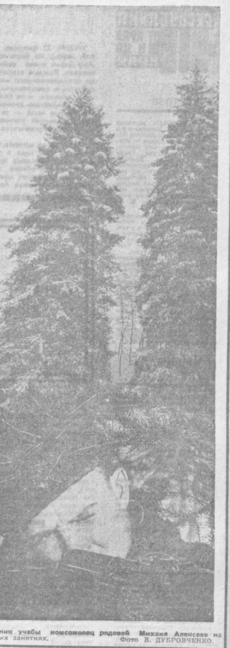
Отличник учебы комсомолец рядовой Михаил Алпесов на полевых занятиях.