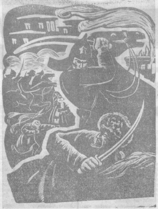
К. Башаров. «В бою».