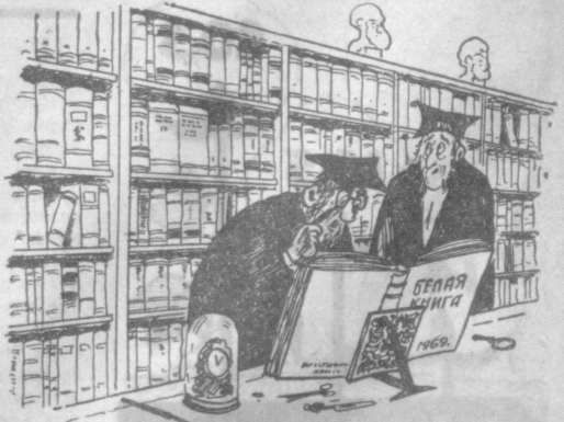
В КОЛЛЕДЖЕ: Кажется, коллег, с учетом сегодняшних цен эта машинка будет стоить нам наших библиотек. Рис. Ю. БРОДИЦКОГО.

Правительство Англии опубликовало «Белую книгу», в которой подтвердило свою политику расширения военного потенциала страны и роста военных расходов.