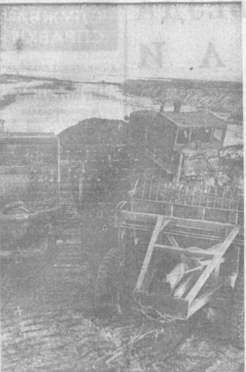
В низовьях Аму-Дарьи ведутся противолодочные работы. Только в Хорезмской области укреплены дамбы общей протяженностью свыше 460 километров. Все работы по предотвращению наводнения механизированы. На снимке: мощная техника на берегу Аму. Ведется отсыпка дамбы.

К 100-ЛЕТИЮ со дня рождения В. И. Ленина в издательствах страны намерено выпустить большое количество исследований, документальных и статистических сборников, художественных и публицистических произведений, всего более 700 названий, альбомов и плакатов, репродукций и плакатов. В издательстве политической литературы к 1970 году выйдет дополненный 110-тысячный тираж всех 55 томов Полного собрания сочинений В. И. Ленина. Характеристике этого собрания посвящена книга Политиздата «Сокровищница великих идей ленинизма», в которой отмечаются особенности 5-го издания, его отличия от предыдущих, рассказывается о новых ленинских документах, публикуемых впервые. Политиздат выпустил новое издание избранных произведений В. И. Ленина в 3-х томах. В них включены все основные произведения Ленина, рекомендуемые для изучения в системе партийной учебы, а также в вузах и средних специальных учебных заведениях. Произведения В. И. Ленина «Что делать?», «Шаг вперед, два